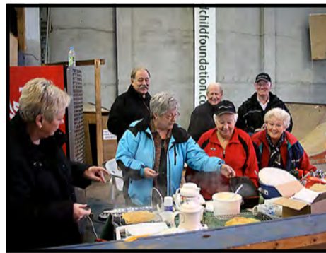
VAFFELGJENGEN fra Civitan er som vanlig på plass.

– 24 deltakere fra Askøy Behandling, Floen Kollektivet og fra Hjelpestad Klinikken hadde vi med. Det hele ble en under-