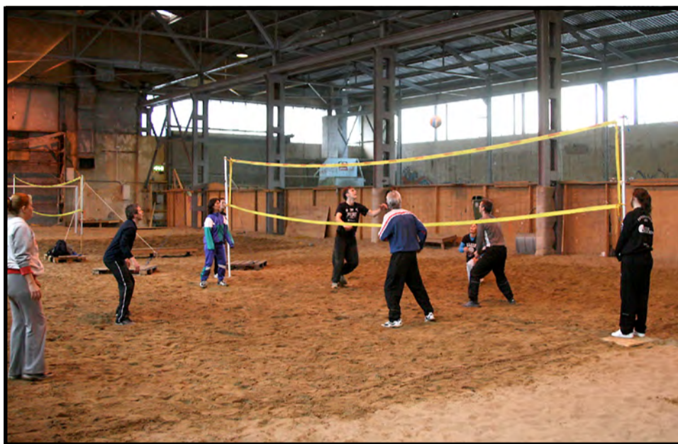
KJEMPEMORO: Sandvolleyball en hel dag ble utrolig godt mottatt av deltakerne.

– God hjelp til både oppvarming og selve turneringsavviklingen, fikk vi av to flotte jenter fra Lyderhorn Volleyball klubb.